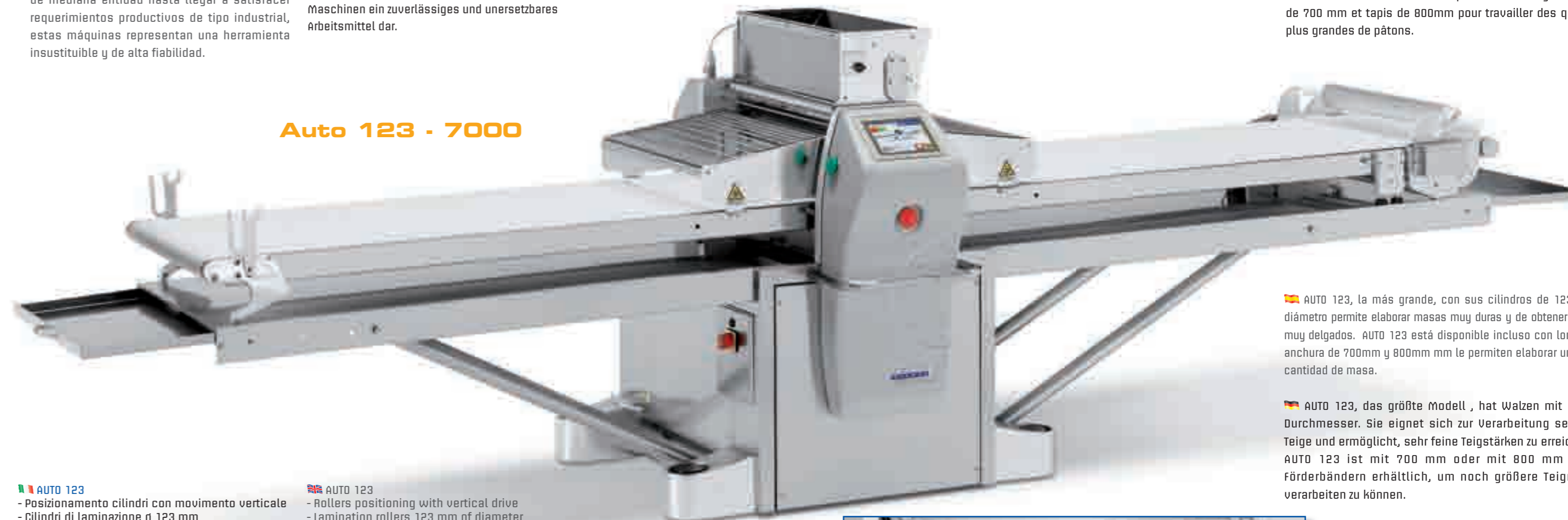
Auto 123 - 7000

IT AUTO 123 - Posizionamento cilindri con movimento verticale - Cilindri di laminazione Ø 123 mm - Velocità nastri variabile da 20 a 120 cm/sec - Pannello "touch screen" da 8 pollici a colori - Avvolgitore automatico sistema "stress-free" - Sfarinatore a quantità regolabile Optional: - Programmazione larghezza pasta - Sistema di taglio a rulli e velocità variabile